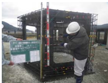
①魚礁ブロック配筋段階確認状況