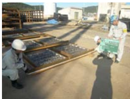
⑧魚礁ブロック 材料搬入確認状況