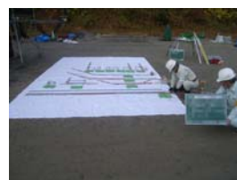
③魚礁ブロック 鉄筋加工寸法確認状況