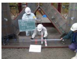
③鉄筋組立確認状況