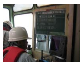
⑧沈設位置確認状況