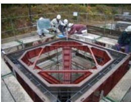
③型枠組立確認状況